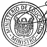
JAIME SAAVEDRA CHANDUVI Ministro de Educación